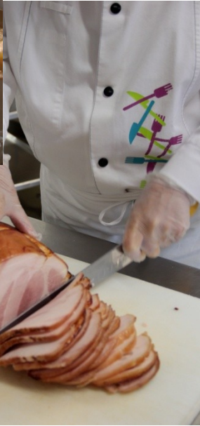
Cuisson des jambons des porcs de la ferme du Lycée