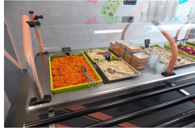
Des préparations « maison »